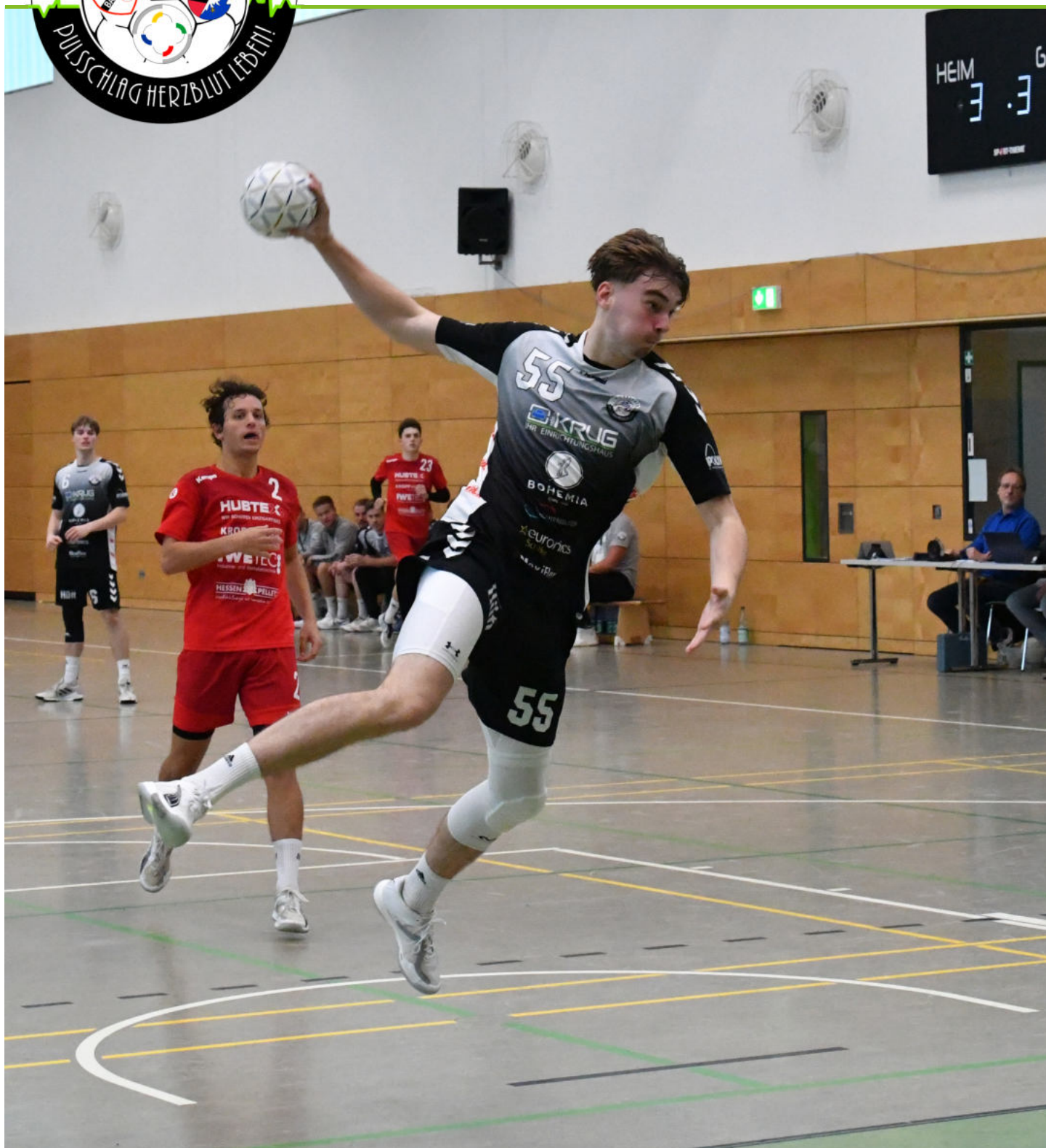
Ausgabe 02 | Heimspielwochenende 28./29. September 2024 | hsg-baunatal.de

Das aktuelle Hallen-Magazin der HSG Baunatal