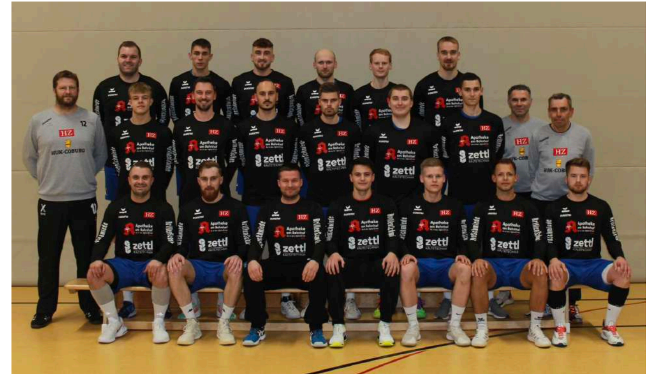
TV Hersfeld (Archivfoto)